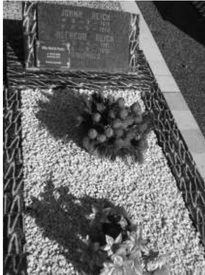
Figura 9. Jazigo de flores e brita branca (a)