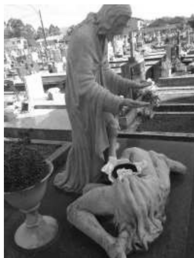
Figura 1. Escultura Cristo e mulher ao chão