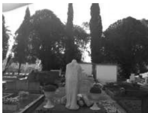
Figura 4. Vista para os fundos da escultura Cristo