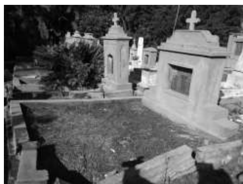
Figura 6. Vista lateral de um jazigo destruído