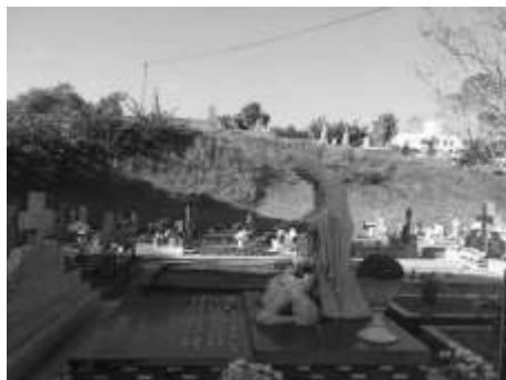
Figura 3. Vista lateral da escultura Cristo