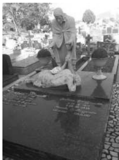
Figura 2. Jazigo Cristo e mulher ao chão