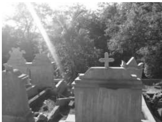
Figura 7. Vista dos fundos do jazigo destruído