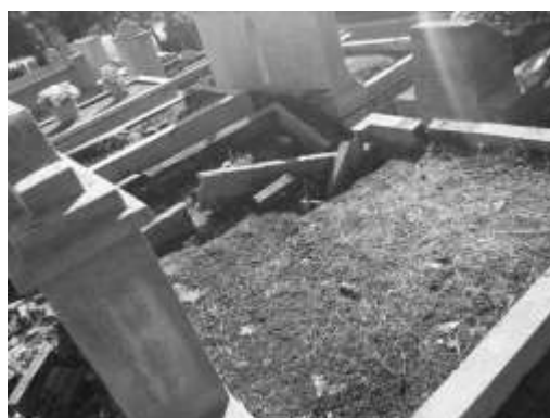
Figura 8. Vista do jazigo destruído