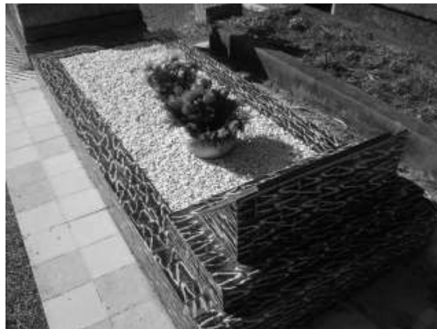
Figura 10. Jazigo de flores e brita branca (b)