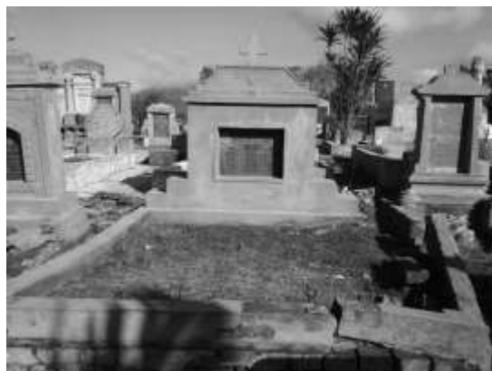
Figura 5. Vista frontal de um jazigo destruído