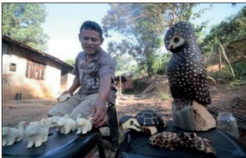
Figura 4. Artesanatos produzidos na aldeia