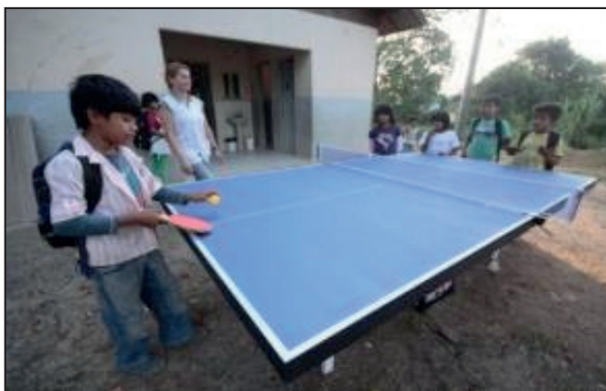
Figura 5. Escola Estadual Indígena Cacique Wera Pukú