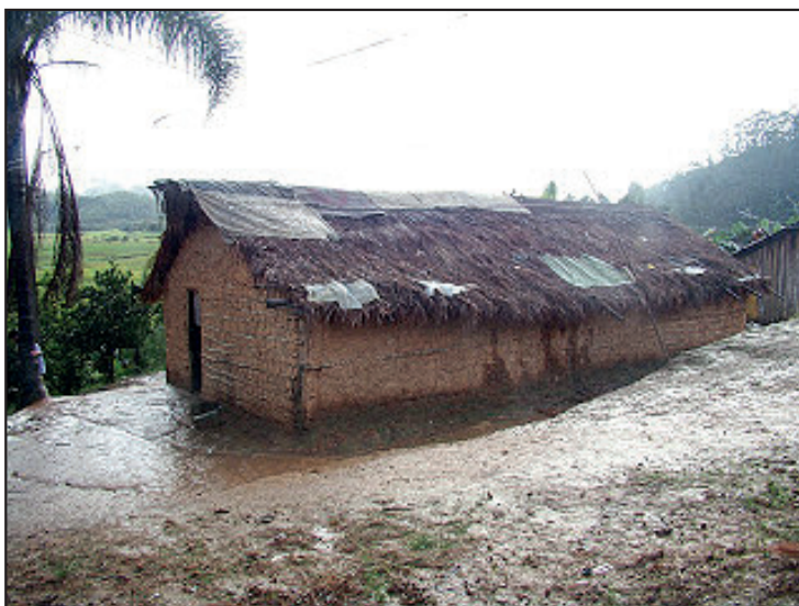
Figura 3. Casa de reza

Fonte: Disponível em: < http://nossapauta.blogspot.com.br/2011/05/alunosdejornalismoe-publicidadedo >. Acesso em: 4 maio 2015.