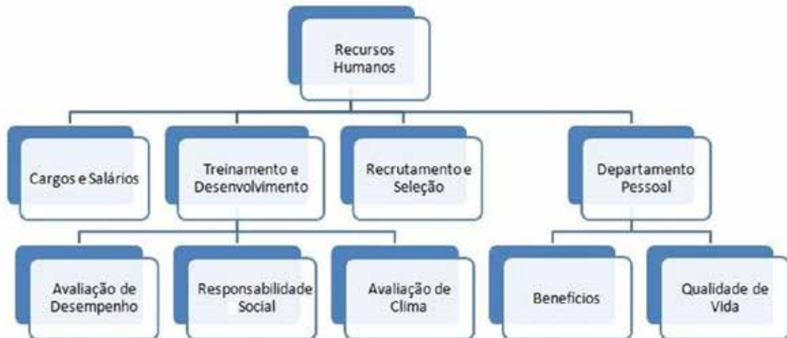
Figura 2. Organograma de treinamento de RH