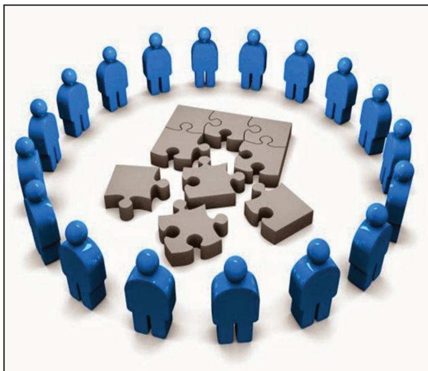
Figura 2. A escola: um quebra-cabeça?