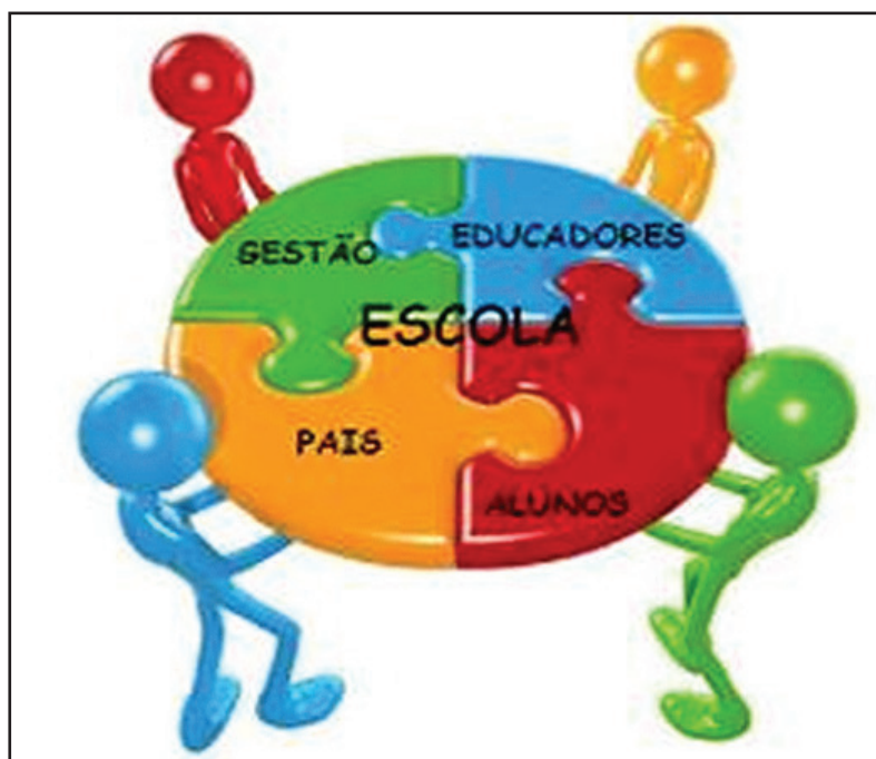
Figura 1. A escola vista em diferentes percepções