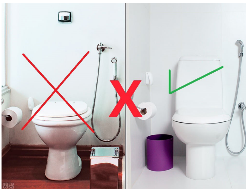
Figura 5. Tipo de vaso sanitário adequado para economia de água

Fonte: Disponível em: < http://casa.abril.com.br/materia/banheiro-caixa-acoplada-ou-valvula-de-parede >. Acesso em: 28 abr. 2015.