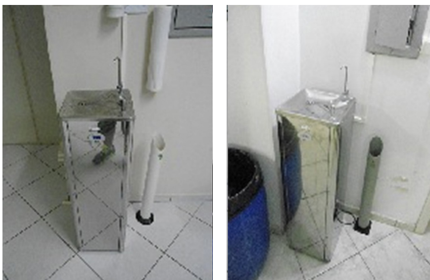
Figura 1. Bebedouros disponibilizados no polo

Com relação ao consumo de água em cada ponto identificado na localidade, fizemos uma observação mais detalhada dos bebedouros (Figura 1), usados para beber água sem a necessidade de recipientes, percebemos o desperdício de água. Isso se deve à própria forma como o equipamento funciona, ele aciona a água para fora do bocal quando o usuário pressiona o botão, e o fluxo de água que sai é alto. Muitas vezes, isso faz com que se desperdice a água que não entra na boca da pessoa, quando ela bebe diretamente nele. Portanto, os bebedouros são sistemas ineficientes, que com certeza precisam de uma atenção especial.