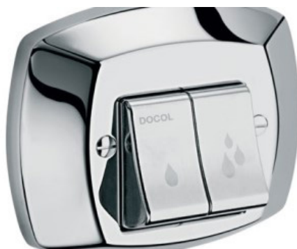
Figura 6. Válvula adequada para economia de água