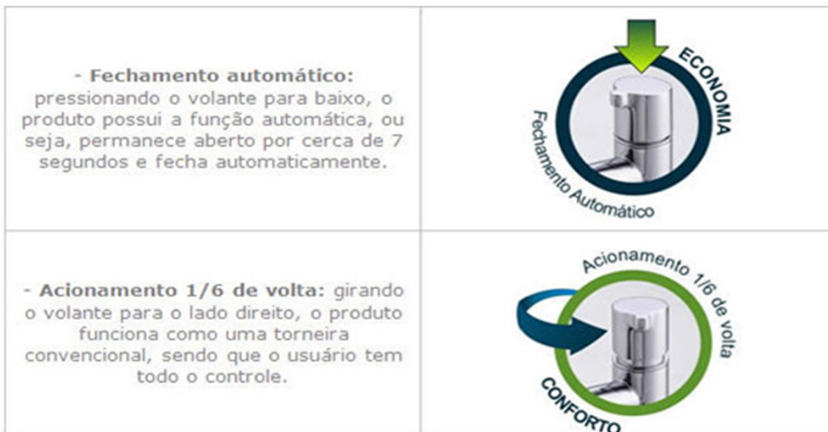
Figura 8. Processo para economia de água utilizando adequadamente a torneira