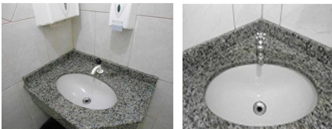
Figura 2. Torneiras disponibilizados nos banheiros do polo

No caso das torneiras dos banheiros, o tipo que predomina no Polo são as torneiras de plástico e metal tipo rosca, que pode ser considerada eficiente se manejada corretamente, principalmente quando o usuário termina sua higiene. No entanto, observamos que algumas delas já demonstram gastos em seus componentes, dado ao elevado número de acionamento pelos seus usuários, fazendo que estejam com gotejamentos pela falta de manutenção e desgastes.