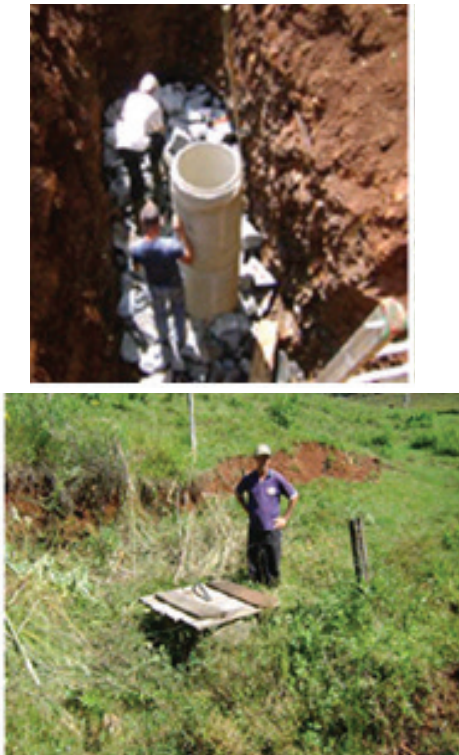
FIGURA 2 – IMPLANTAÇÃO DE PROTEÇÃO DE FONTE TIPO TUBO VERTICAL