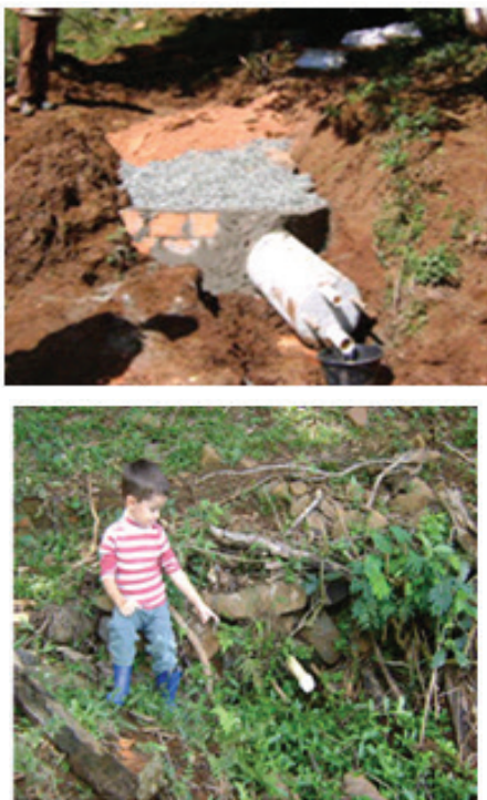
FIGURA 3 – IMPLANTAÇÃO DE PROTEÇÃO DE FONTE TIPO FONTE CAXAMBU