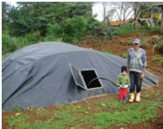
FIGURA 4 – CISTERNAS UTILIZADAS NA MICROBACIA DO RIO DO PEIXE

tipo de programa o financiamento em longo prazo e com taxa de juro zero.