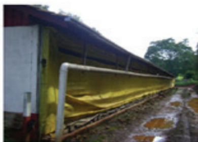
FIGURA 1 – SISTEMA DE CAPTAÇÃO DE ÁGUA DA CHUVA

Este sistema é constituído por três componentes, sendo um sistema de captação de água do telhado com uma calha revestida com sombrite e tubo coletor, um sistema de filtragem formado por uma caixa de eliminação da primeira água e pré-filtro, e uma ou mais cisternas, que, nada mais é ou são que um reservatório enterrado, fechado e de baixo custo para o armazenamento das águas da chuva vindas do telhado, mas também armazenando o excesso da água das fontes protegidas.