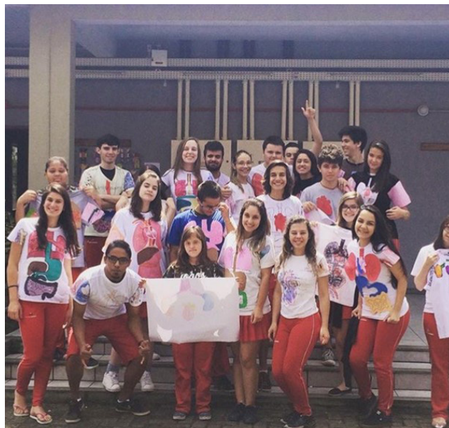
Figura 2. Alunos vestindo o trabalho da camiseta humana